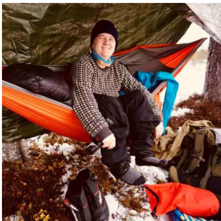
Det går helt fint å sove ute i hengekøye selv om det er november.