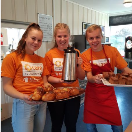
Elevene på Fjellsport og Kajakk NZ serverte kaffe og boller.

jobbe et halvt år. Søsteren min hadde allerede gått et år på folkehøgskole, så jeg surfet litt på nettsiden til folkehøgskolene . Det var der jeg fant ut at det var mulig å gå halvtårskurs, og ble fort overbevisst om å søke på det. (Les mer i bloggen)